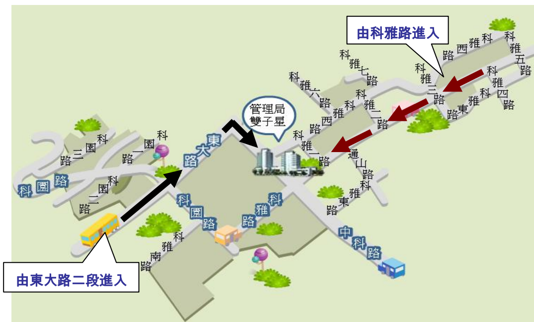
【圖一 中科園區內路線圖】

自中彰(74 號)快速道路 ：下西屯三交流道→銜接西屯路三段→右轉東大路二段→進入中科園區→續行東大路二段→右轉中科路至科雅路交叉口。