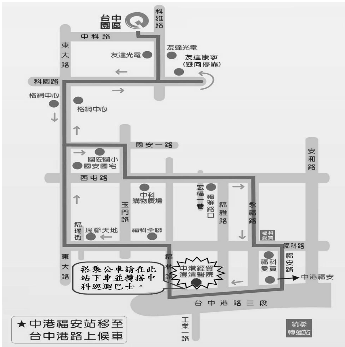
圖四 中科免費巡迴巴士(西屯線)路線圖