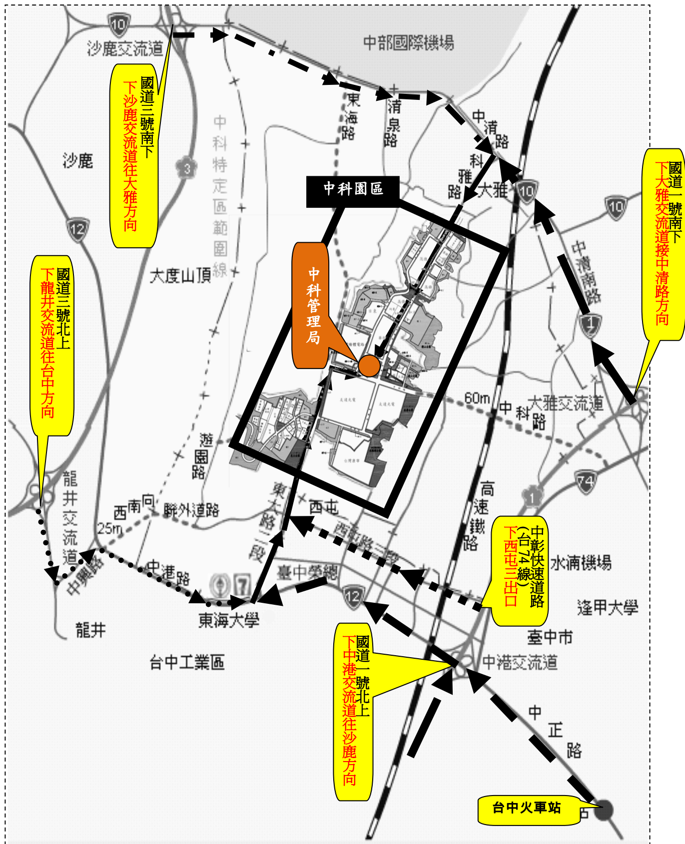
【圖二 自行開車前往中科園區路線圖】