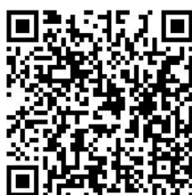
報名網頁 QR CODE